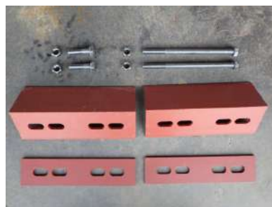
ジョイントプレート ジョイントアングル