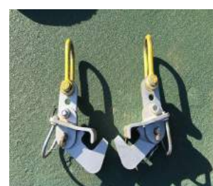
横吊り君 S タイプ