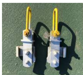
横吊り君 K タイプ